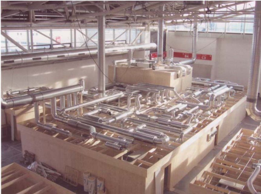
Vue générale intérieure du centre des médias

Structure éphémère construite pour la durée de l'événement.