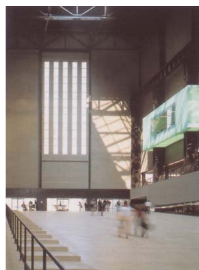
Vue intérieure de l'ancienne halle des turbines