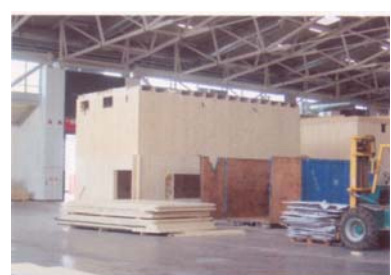
Montage et démontage des panneaux modulaires porteurs