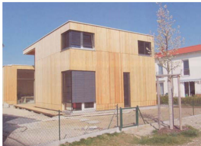
Réutilisation après l'événement, des panneaux porteurs (fabriqués industriellement en bois multiplis contrecollés) du centre des médias, dans la construction d'une maison individuelle