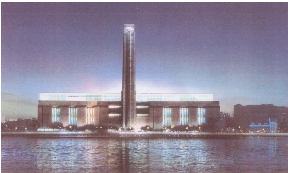
Vue extérieure générale, entrée nord

Réutilisation de la structure de l'ancienne usine électrique pour l'aménagement du musée.